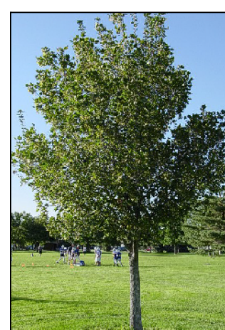
1 Acer campestre (Acer campestre)