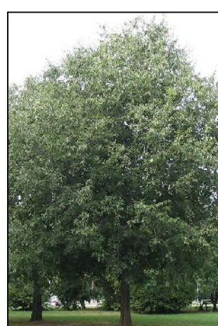
3 Bagolaro (Celtis australis)