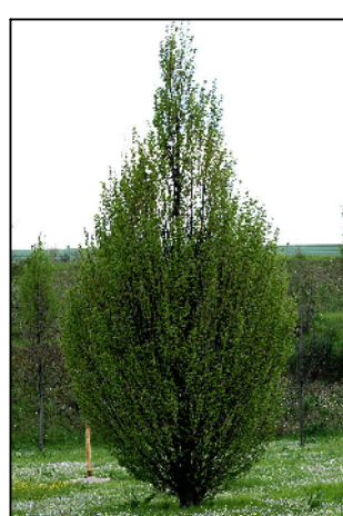
2 Carpino bianco (Carpinus betulus)