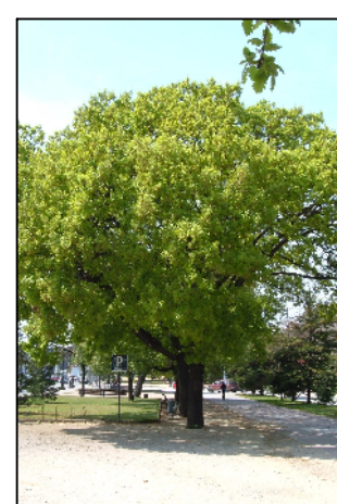
4 Roverella (Quercus pubescens)